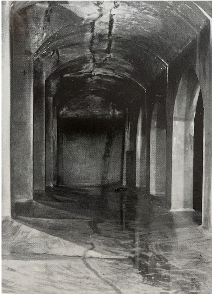
Blick in das 1979 stillgelegte Wasserreservoir.