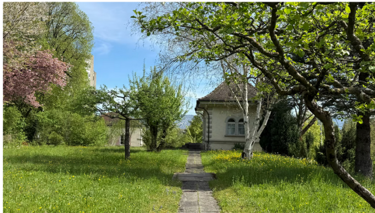
Im Sommer ist das Albishof-Areal eine grüne Oase.

Der Stadtrat schreibt, es seien noch keine Entscheide zur langfristigen Nutzung gefallen. «Generell ist jedoch zu sagen, dass die gesetzlichen Hürden für die Nutzung von unterirdischen Bauten, die ursprünglich nicht dafür vorgesehen waren, sehr hoch sind.» Sprich: Ob das Reservoir je genutzt werden kann, ist offen.